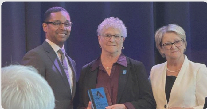
Elle a eu l'honneur de recevoir son prix des mains de la ministre responsable des Aînés, Mme Caroline Proulx, et du Ministre responsable des Services sociaux, M. Lionel Carmant.